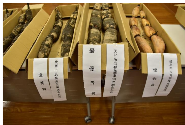
昨年は114点が出品されました