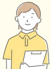
居宅介護支援事業所