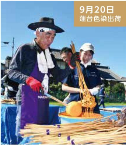
9月20日 蓮台色染出荷