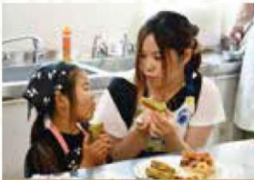
7月21日 ときめきレディース 第一回