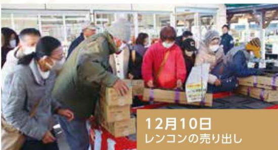
12月10日 レンコンの売り出し