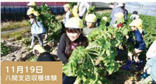
11月19日 八開支店収穫体験