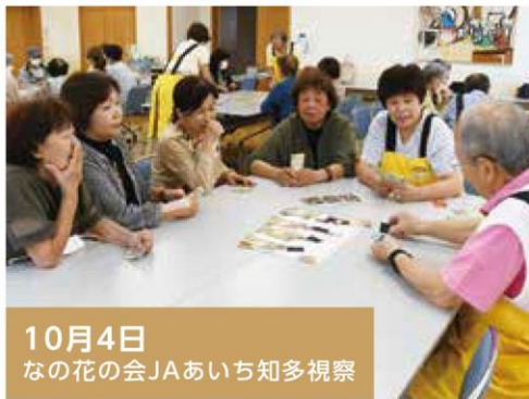
10月4日 なの花の会JAあいち知多視察