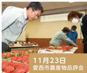
11月23日 愛西市農産物品評会