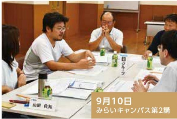
9月10日 みらいキャンパス第2講