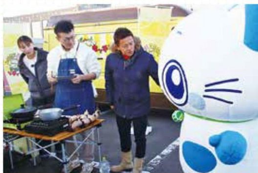
出演者の方々と共演するあまにゃん