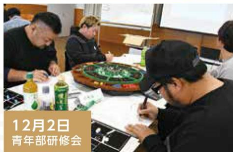
12月2日 青年部研修会