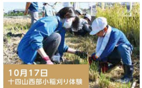
10月17日 十四山西部小稲刈り体験