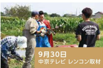
9月30日 中京テレビ レンコン取材