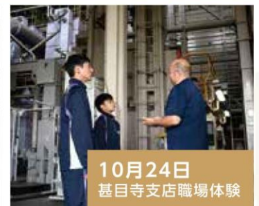
10月24日 甚目寺支店職場体験