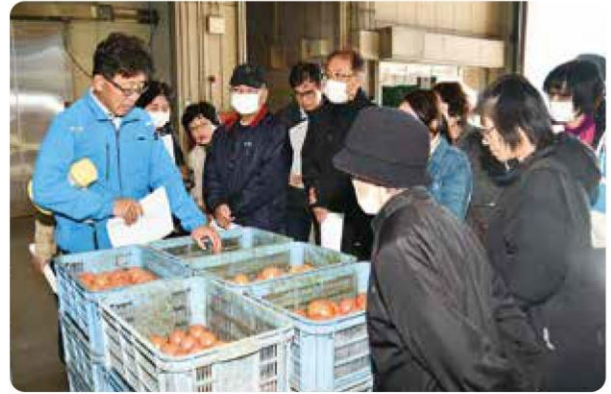
トマトセンターを見学する参加者

参加者は「普段は知ることのできない施設や農園の内部を見学することができ、大変貴重な経験をすることができました」と話しました。1月下旬には、当JA職員との意見交換会を予定しています。