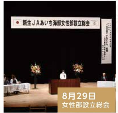
8月29日 女性部設立総会