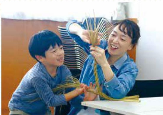
親子で楽しくしめ縄を制作

同組織ではバケツを用いた稲の苗の定植や収穫を通じて、日本の主食であるお米や農業に対する理解促進に取り組んでいます。当日は、参加者が育てて収穫した稲のわらを持参してしめ縄製作に取り組みました。親子で協力して稲わらを編み、リース型にしたあと、思い描いた作品になるように水引や稲穂、紙垂などの飾り付けを楽しみました。最後には粉付きの米から作る「ポップライス」をお土産として参加者へ手渡しました。