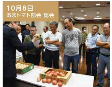
10月8日 あまトマト部会 総会