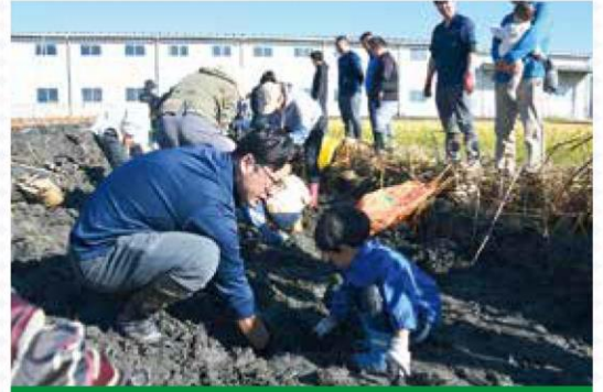
収穫をサポートする職員

イベントを企画した職員は「レンコンはJAあいち海部の特産品の一つ。普段は農業との関わりが薄い利用者の方にも地域農業に関心をもってもらうため、部署を超えて連携を図っていきたい」と話しました。