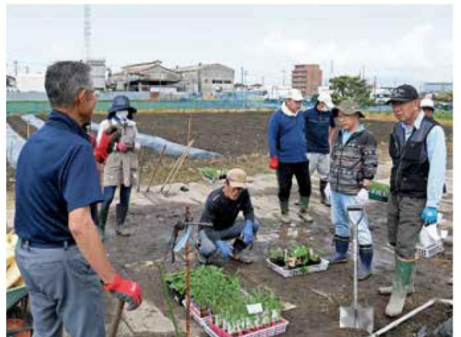
作業について学ぶ参加者

今回は定植作業について実習を行い、参加者は8品目の夏野菜を植えました。実習では作業を通じてポイントを伝えるとともに、栽培の楽しさや収穫時の達成感など、農業の魅力を知ってもらうことにも重点を置いています。