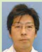
乳腺・内分泌外科 代表部長

また、食事の量にも注意が必要です。肥満はホルモンのバランスを崩し、乳がんの発症リスクを増加させることが知られています。適切な体重を維持するためには、バランスの取れた食事と適度な運動が不可欠です。