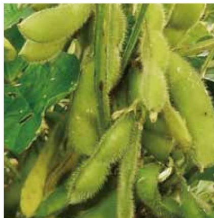
収穫間近のエダマメ

エダマメは大豆を若どりしたもので、植物としては同じものです。エダマメは畑の畑肉といわれる大豆の良さを持っており、良質なタンパク質を多く含んでいます。そのタンパク質に含まれるアミノ酸の一種であるメチオニンは、アルコールの分解を助けてくれますので、ビールにピッタリです。