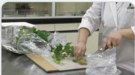
届いた農産物は検体として適した形になるように包丁やフードプロセッサーなどを用いて細かくします。

また、基準値の超過や適用外の農薬が検出された場合は生産履歴記帳シートをもとに問題の発生原因を把握できるようになっています。