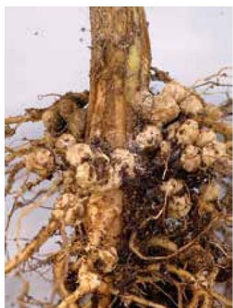
エダマメの根に共生した根粒菌

微生物である根粒菌がエダマメの根に侵入し、増殖して根粒を形成します。根粒菌はエダマメから糖の栄養をもらう一方で、空中の窒素を固定してエダマメに与えてくれるので、窒素の施肥量が少なくてすむ、ギブ&テイクのよい共生関係にあります。リン酸が十分にあると着生が良くなりますが、窒素の施肥量が多いと根粒菌の働きが悪くなってしまうので注意してください。特に晩生品種では根粒菌が有効に働くことから基肥で必要な窒素成分量は3g/m 2 でよく、中生品種で6g/m 2 、早生品種で9g/m 2 ほどです。多肥では過繁茂となつて着莢不良を招くことがあります。生育が順調なら、追肥は不要です。草勢が弱い場合に、開花期に追肥(窒素成分量2〜3g/m 2 )を施します。