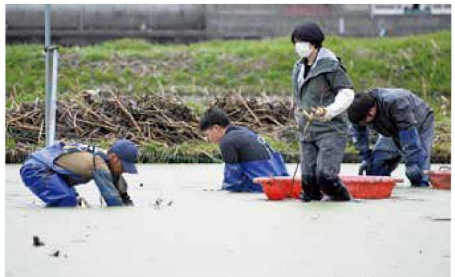
定植を行う職員と生産者

翌5日には昨年度と同様の品種について、季節ごとの生育状況や産地適性を追加調査するため、今年度の定植を行いました。調査を通してハウス栽培と露地栽培での通年出荷に適した品種を選定し、更なる安定出荷を目指していきます。