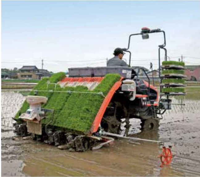
順調に田植えを行う山口トラクター

この日JA弥富地域農業機械銀行受託部会に所属する山口トラクターはおよそ2ヘクタール田植えを行いました。順調に育てば8月上旬に収穫、中旬から出荷が始まります。