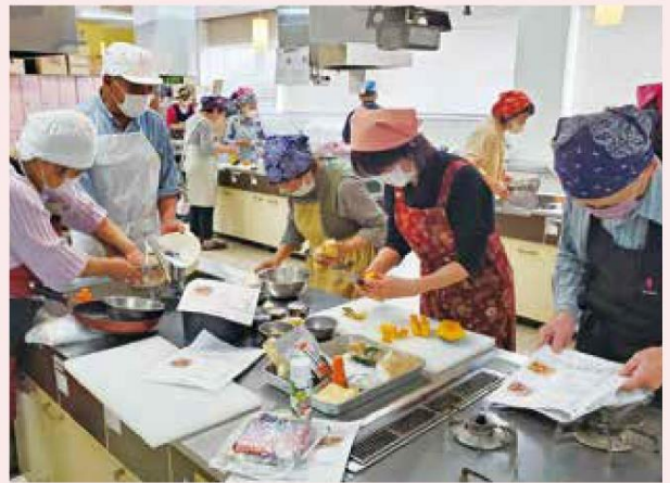
調理をする参加者

1回目の開催となるこの日は「自立神経を整える食事」をテーマにひじきとツナの炊き込みご飯や新タマネギと納豆のおやきなど5品を調理しました。