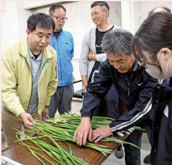
出荷規格を確認する生産者と市場関係者

愛西市立田地区は国内で出荷される花菖蒲の7～8割を生産する全国一の産地です。木曾川の豊かな伏流水に恵まれた地域特性を活かして長年花菖蒲が栽培されています。