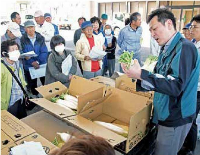
規格を確認する生産者

この日は、生産者や市場担当者、JA担当者を含め44名が参加してサンプルを見ながら重さや長さ、外観などの出荷規格について確認しました。